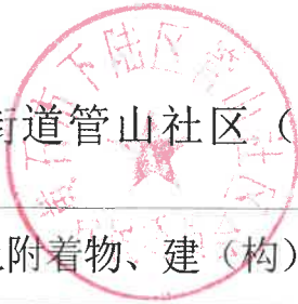
征收土地房屋、青苗、地上附着物、建（构）筑物调查表